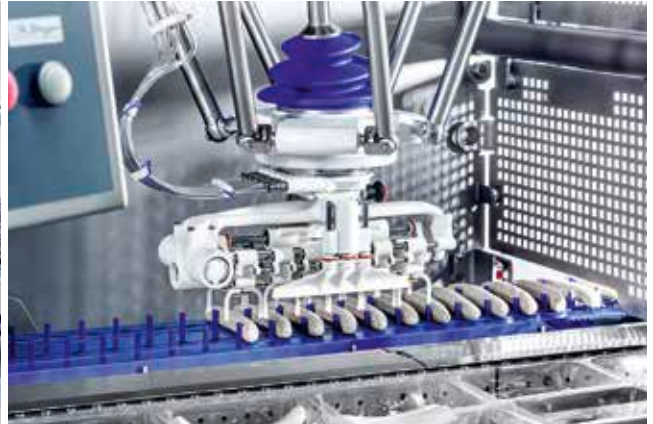
Loading system Typ V-G-E – zum Einlegen von Produkten direkt in die Verpackungsmaschine

Das international tätige Unternehmen sticht immer wieder durch neue Entwicklungen und Speziallösungen hervor. So wurde mit HD eine neue Generation der Fördertechnik entwickelt – das Singer Hygienic Design .